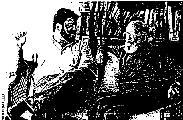
Com Mário Sérgio Cortella, que o substituiu na Secretaria de Educação da Prefeitura paulistana no governo de Luiza Erundina.