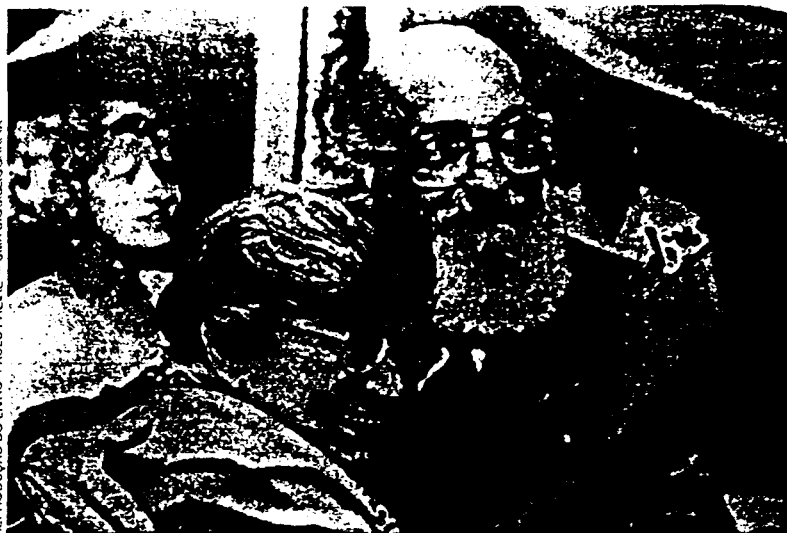
O então secretário municipal de Educação com a prefeita paulistana Luiza Erundina: “É urgente (...) mudar a escola pública, melhorá-la, democratizá-la”.

Paulo Freire foi homenageado numerosas vezes no exterior. Mas só em 1995 recebeu um prêmio no Brasil — o Moinho Santista, pela obra. Dividiu-o com o economista Celso Furtado (76); cada um recebeu 35 000 reais. Ainda em 1995, Freire sofreu um espasmo cerebral que o deixou com seqüelas temporárias, na memória. Na semana passada, quando um infarto o levou, às 6h30 da bela manhã de outono, dia 2 de maio, ainda soavam as palavras de uma de suas últimas entrevistas, inspirado na caminhada dos trabalhadores sem-terra: “ Eu morreria feliz se o Brasil fosse tomado por marchas. A marcha dos estudantes, dos trabalhadores, dos que não têm escola, a marcha dos reprovados, dos que querem amar e não podem ”. Pois uma de suas certezas era a de que a esperança não floresce na apatia. ●