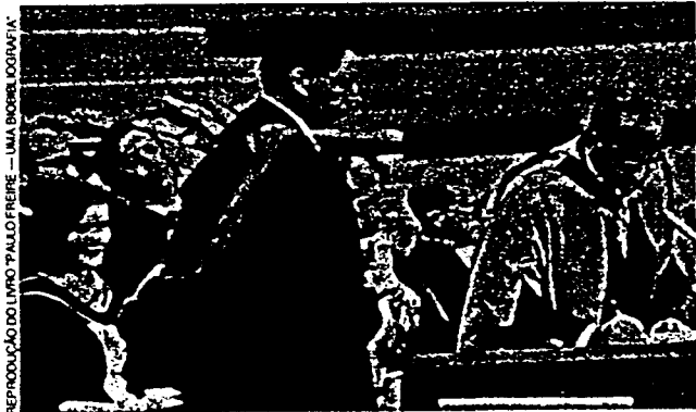
Freire recebe em 1975 o título de doutor honoris causa da Universidade de Louvain, Bélgica: reconhecimento Internacional.