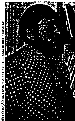
Harvard (EUA), 1969: o frio faz com que deixe a barba crescer.